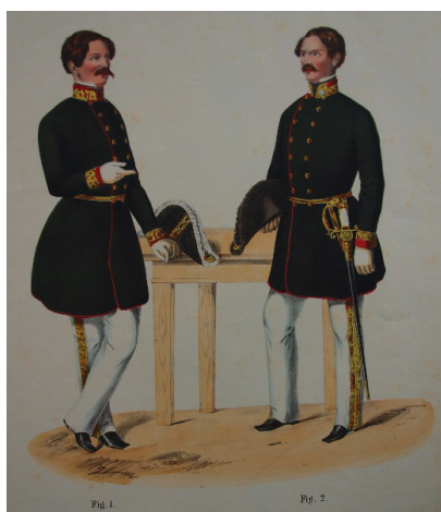
Původní uniformy z roku 1814, podle kterých byly následně vyhotoveny kopie uniformem.

Nošení hornické uniformy se objevuje v době konce napoleonských válek okolo roku 1814, na základě kabinetního listu z 18. dubna, kdy se císař František I. rozhodl, že uniformu budou nosit všichni státní zaměstnanci a ne jen někteří. Uniforma byla z tmavozeleného fraku s barevnými sametovými výložkami na stojatém límci a manžetách, bílou vestou a bílými nebo černými kalhotami. Na hlavě se nosil třírohý klobouk s kokardou a klíčkou a u pasu kord s císařským orlem. Jednotlivé báňské funkce byly rozlišeny vyšíváním na fraku, typem stejnokroje a barvou výložek. Hodnostní třídy (bylo jich 12) se odlišovaly jednotlivými kategoriemi (byly 4), počtem