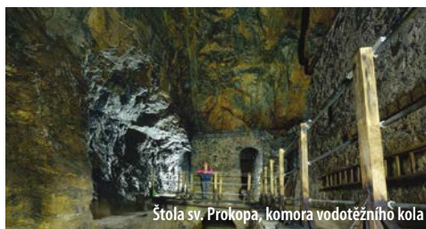
Štola sv. Prokopa, komora vodotěžního kola