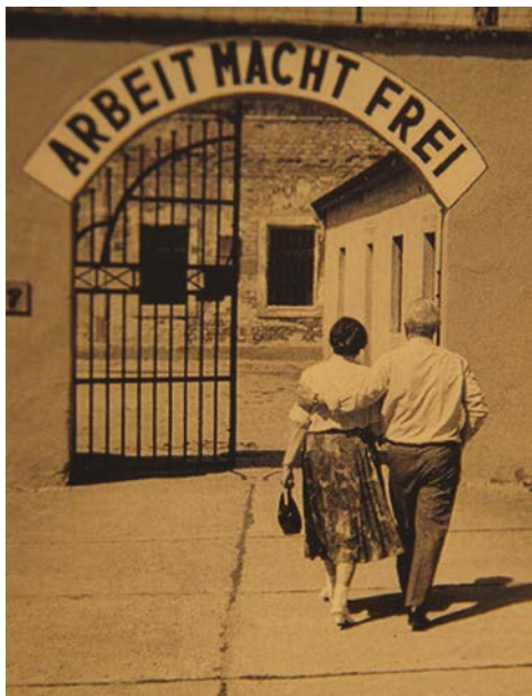
S manželkou na prohlídce, Malé pevnosti Terezín