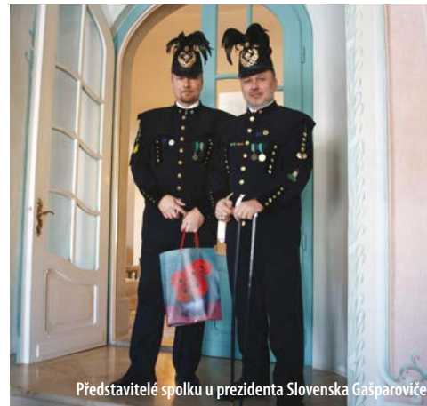
Představitelé spolku u prezidenta Slovenska Gašparoviče